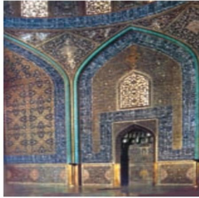
نمایی از مسجد شیخ لطف الله در اصفهان

۱- خداوند از چه زمانی حقوقی را به انسان عطا کرده ؟