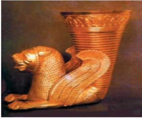
جام طلایی از دوره هخامنشیان

دبیرستان استعداد درخشان علامه حلی ۱۱ ( دوره ی اول ) تهیه ی و تنظیم : محمد بهر فر