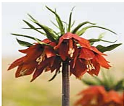
لاله و ازگون